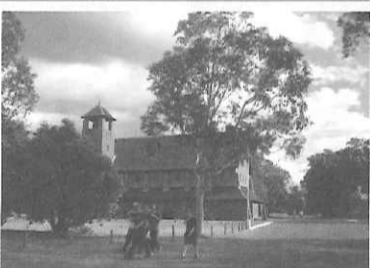
自然たっぷりのフェアブリッジ・ヴィレッジ

フェアブリッジ・ヴィレッジ NPO法人が所有運営する、宿泊と体験施設。体験活動プログラムも豊富に用意されており、パースの小・中高校やユース団体等多くの機関が利用している。施設内に大小様々な52のコテージ(6人～50人)が点在し、グループからクラス単位までの収容が可能となっている。また、同時に滞在している現地の学生団体とエコ活動をいっしょに行ったり、食事を共にすることもでき、異文化交流を深めることも可能だ。