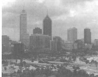
キングスパークからパース中心部を望む