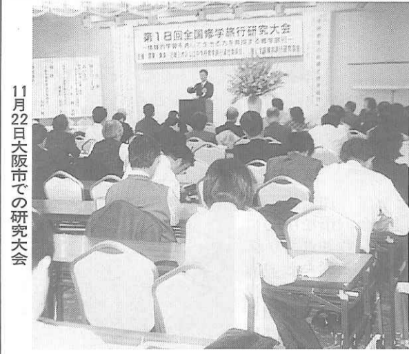
11月22日大阪市での研究大会

子どもたちの学びはあつたか、最後の日、東京の大田市場に行き自分たちの生活を改めて見直すという活動ができた。先生方にお会いできること、発表を伺い、これから教育について一緒に考えることができて、大きな意味がある。2校の子どもの大きな動きの中にある。平成4年、松原二中は本日の意味で自分の学校でどんな子どもを育てたいかを明確に意識し、作り上げた修学旅行だ。伊丹東は、トライやるウイークの成果も生かし、スクール・パソコン 子どもたちの学びはあつたか、最後の日、東京の大田市場に行き自分たちの生活を改めて見直すという活動ができた。先生方にお会いできること、発表を伺い、これから教育について一緒に考えることができて、大きな意味がある。2校の子どもの大きな動きの中にある。平成4年、松原二中は本日の意味で自分の学校でどんな子どもを育てたいかを明確に意識し、作り上げた修学旅行だ。伊丹東は、トライやるウイークの成果も生かし、スクール・パソコン 子どもたちの学びはあつたか、最後の日、東京の大田市場に行き自分たちの生活を改めて見直すという活動ができた。先生方にお会いできること、発表を伺い、これから教育について一緒に考えることができて、大きな意味がある。2校の子どもの大きな動きの中にある。平成4年、松原二中は本日の意味で自分の学校でどんな子どもを育てたいかを明確に意識し、作り上げた修学旅行だ。伊丹東は、トライやるウイークの成果も生かし、スクール・パソコン