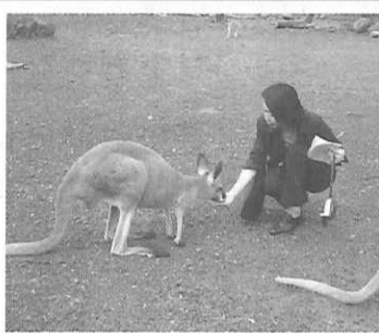
コフヌ・コアラ・パークでカンガルーに餌付け

コフヌ・コアラ・パーク 西オーストラリア州最大のコアラのコロニー。コアラを抱っこし記念撮影ができるが、大人数の学生団体の場合は代表が一人抱っこしての班またはクラス毎の集合写真になるという。100頭ものカンガルーを飼育し、直接餌をやることもできる。オーストラリアの鳥類を集めた野鳥園、エミューやウォンバット、ディンゴなどの動物王国で自然体験を満喫できた。