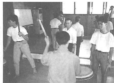
伝統芸能「御陣乗太鼓」体験

特色…上杉軍の能登遠征が発祥と伝えられる伝統の祭“名舟大祭”に由来する芸能体験。敵勢を地元の村人達が様々な面・海草などで飾った姿で追い払った故事を基としており、輪島市文化会館で開催される地元保存会による大鼓の実演見学のほか、その指導による体験練習・舞台演奏が可能。(事前予約が必要)