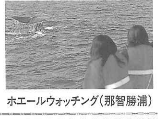
ホエールウォッチング(那智勝浦)

黒潮洗う風光明媚な海岸線、高野・熊野を代表とする神秘的な歴史遺産。和歌山県の自然や歴史を舞台に、様々な実体験を通じて、たくさんの思い出をみなさんで作ってください。(和歌山県観光課より)