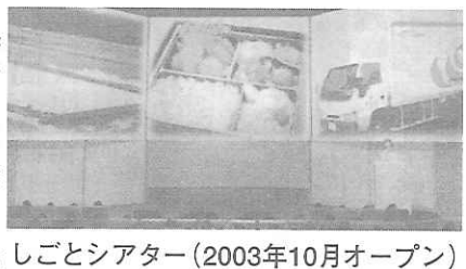
しごとシアター(2003年10月オープン)

将来の夢がない。やりたい仕事がない。そのような若者が少なくありません。深刻化する雇用問題、産業や社会のシフトがわりづらくなつたこと。それに伴う若者たち自身のチャレンジ精神の不足、コミュニケーション能力の欠如等、さまざまな要因があげられています。 しかし、社会や若者たちだけに原因を求めるわけにはいきません。やるべきことを真剣に考え、行動を起こしていくことが何よりも大切だと実感しています。