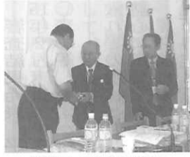
学校への記念品贈呈

今後さらなる拡充が見込まれており、今回の視察もその一助になりうるものと期待される。台湾の修学旅行受け入れについて、海外修学旅行の最大の魅力は、異なる文化・生活する人々との直接的なふれあいであり、とりわけ学校訪問では、交流会・双方の学生によるパフォーマンス・授業参観など様々なプログラムが考えられる。台湾政府・交通部観光局は、学校レベルの国際交流を積極的に推進し、台湾の修学旅行受け入れについて、海外修学旅行の最大の魅力は、異なる文化・生活する人々との直接的なふれあいであり、とりわけ学校訪問では、交流会・双方の学生によるパフォーマンス・授業参観など様々なプログラムが考えられる。