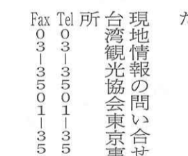
周校長から学校概要の説明

9月からの新入生を対象とした入学説明会があり、学校訪問プログラムの一環として、見学をさせていただいた。日本語の教職員をはじめ、多くの学生たちが、日本語及び英語によるコミュニケーションを図り、現地の語学教育の充実を体感できた。