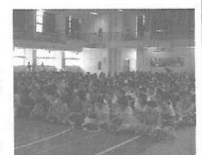
新入生たちの説明会を見学