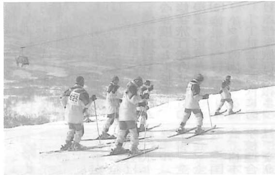
スキー研修の様子

平成13年度開催の「第1回修学旅行ホームページコンクール」から、特色ある修学旅行の学校ホームページ事例として、本号では入選作品・兵庫県立西宮今津高等学校の事例をご紹介します。