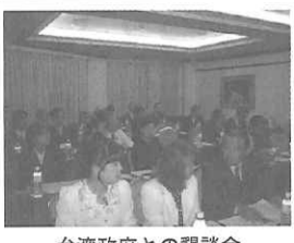
台湾政府との懇談会