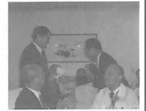
台湾政府教育部との懇談会

去る8月25日から4日間の日程で、関東地区の公立高等学校の校長・教員14名の参加による「台湾修学旅行現地研修会」が実施された。この視察は7月26日、東京・私学館で開かれた「台湾修学旅行セミナー」(財団法人全国修学旅行研究協会主催)を受けて、「台湾における学校間交流」「台湾修学旅行の魅力」などをより深く体験することを目的に、台中・台北地区を中心に現地研修が実施された。