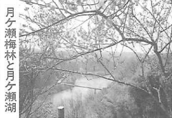
月ヶ瀬梅林と月ヶ瀬湖

二十世紀の開幕。陽が昇る。夢と希望をそれぞれ胸に託して、人々は活動を始めた。しかし、太陽暦の新年は厳しい冬の最中にある。風が冷たい。