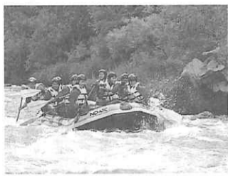
夏の体験 ラフティング

北の大地・北海道は、国立・国定公園などを背景とする雄大な自然環境をはじめ、北方的な文化や風俗、体験学習施設など、校外学習の研修地として四季にわたり豊富な素材を有し、修学旅行の学習の場として最適です。