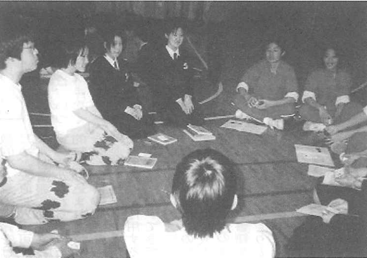
修学旅行での異文化理解の学校交流 (岩手県金石市立甲子中学校)

関修委とJR東日本・JR東海との意見交換会では、JR東日本・JR東海、東海修委はJR東海と本年度の連合列車の総括及び平成16年度の連合列車運行についての意見交換会を実施した。