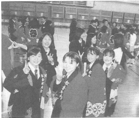
東京中華学校での学校交流

グループ毎に分かれてのグループレポート。交流の感想、挨拶、レク(リエーション)では、最初は少し消極的だったものの、相手の方がとても積極的だったので、自分の心の中にあつた「恥づかしさ」が消えていき、とても楽しく交流できた。『初めは外国人という大きな壁をのり越えての交流をできるかどうか不安でした。』でもレクリエーションの時、おろおろしている私達に何度もかわるがわる女の子達が声をかけてくれました。次にやった各班の交流会でもみんな積極的に私達の質問に答えてくれました。日本語をあまり話せない子もわかる友達に聞いて一