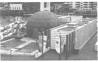
北九州市立環境ミュージアム

アジアへの玄関口・福岡県は、その恵まれた地理的条件を活かし、様々な新しい文化との出会い、体験ができる地域です。古くからの歴史と新しい文化・体験がミックスする九州の中心都市・福岡と、学術・研究にも秀でた有数の大工業都市・北九州を中心に、優れた教育旅行素材を紹介します。