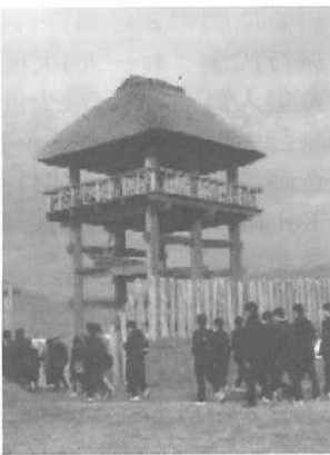
(クラス別研修・吉野ヶ里遺跡)

ホームページの具体的な内容としては、生徒達が目地的に行き先について事前に学習を行う際に役立つ「事前版」(関連サイトへのリンク集、旅行中の様子を紹介した「事中版」、全体のまとめとしての「事後版」)から構成されており、生徒たちの日記的報告・感想とフォトアルバムを中心に分かりやすくまとめられており、先生方による率直な感想が感じ取れるコラム・対談など、非常に興味深い内容となっている。