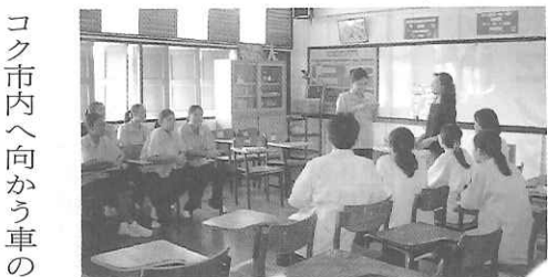
フランス語の授業風景

し、相互理解を促進し、学校正面入口では、語の選択がある。パソに国際体験を積み重ねる機会となる。タイの学校制度は日本と同じ6・3・3制で2学期制(1学期は5月10月初旬、2学期11月10月上旬が多い)が教室の中から聞こえる。女性校長をはじめ各教科スタッフが国政府観光庁ではユー