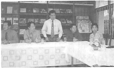
日本との学校交流を希望している パンヤーオクラン学校の先生方

タイの中・高校生との交流 海外修学旅行の目的の一つとして、学校交流・交換が挙げられる。これは、日常の学習で習得した外国語能力を生かし、お互いの文化を紹介