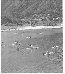
四万十川カヌー体験