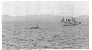
ホエールウォッチング(大方町)

高知県は、雄大な太平洋や清流四万十川に代表される自然環境、坂本龍馬をはじめとする勤王の志士や自由民権運動を育んだ土壌が、環境・体験学習のフィールドとなります。何かを探しに、何かを求めに来る人には必ずその何かが見つかるはず。高知の海も山も川も、きっとすばらしい思い出を残してくれるはず。まあ、いっぺん来てみいや〜(おいで下さい) [高知県文化環境部観光振興課より]