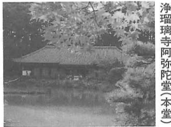
浄瑠璃寺阿彌陀堂(本堂)

わらい仏から数百メートル、田畑を望む眺めのよい尾根を歩き、「唐臼の壺」と呼ばれる四つ辻までくると、その一角に阿彌陀・地藏磨崖仏がある。共に康永二年(一三三三)の銘があり、当尾で銘のある石仏では最も新しい。 逆に最も古いのは、そこ