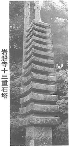
岩船寺十三重石塔

現地情報全般についての問い合わせ先: 県東部: 高知県観光振興課(東部担当) TEL0887-32-0361 県西部: 幡多広域観光推進連絡協議会 TEL0880-31-1155 URL http://www.gallery.ne.jp/~hatamap/ (幡多マップ) 県全般: 高知県文化環境部観光振興課 TEL088-823-9608 URL http://www.pref.kochi.jp/(高知県) URL http://www.attaka.or.jp/(観光情報ネット) TEL03-3501-5541(代) 高知県東京事務所