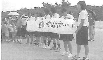
津堅中学校との感動的なお別れ

3. 実施までの取り組み (平成15年度) @「津堅通信」と「清川通信」による交流 @平和学習のまとめ「沖繩の戦い」につ