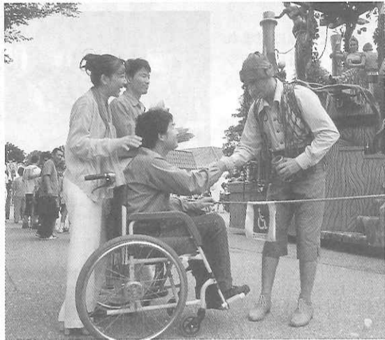
昨年の「ふれあいフェスタ99」

伊勢志摩国立公園内にある志摩スペイン村は、バリアフリーイベントを「ふれあいフリーパーク」を「ふれあいフェスタ2000」として、昨年同様、本年11月1日(水)より11月7日(火)までの7日間、志摩高原で林間学校を実施した。