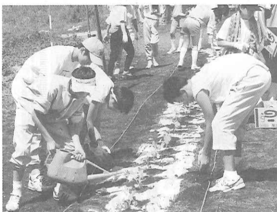
尚、農業体験のメニューとしては、畑の耕しのほか、野沢菜・大根・キャベツ・ジャガイモ・とうもろこしの種まき・苗植え・収穫、りんごの摘果作業、えのきだけの作業・収穫、などが季節に応じて可能とのことである。

浦和市立岸中学校の生徒たちは畑のうね立てや大根・野沢菜の種まき、キャベツの苗植えなどの初期作業を行った。収穫までの栽培管理はJ.A.志摩高原がカバーし、収穫された作物は学校に発送することである。