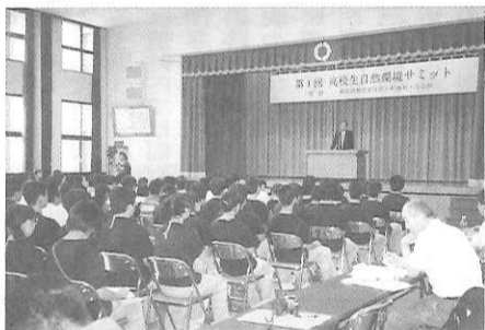
サミットのまとめとして、した問題に適切に対処して活動の指針ともなるべき「高校生自然環境宣言」を採択、今後の環境学習への取り組みを推進して、今回の環境サミットにおいてもその主導的な役割を担うこととした。

去る8月1日(火)3日(木)にかけて、群馬県尾瀬高等学校を幹事校として、全国17の高校生・学生団体による「第1回高校生自然環境サミット」(後援：群馬県教育委員会、利根村、片品村)が開催された。