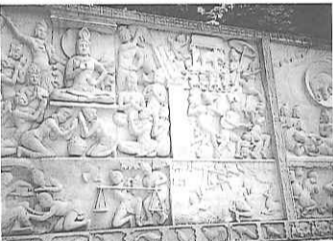
釈迦生涯レリーフ

境内でまず目立つのは端正な三重塔である。室町時代の明応六年(一四九七)建立、江戸時代に大修理が行われている。