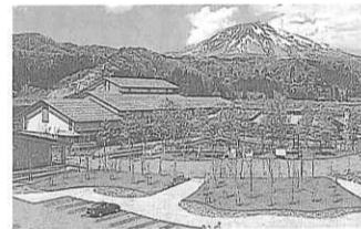
白神山地ビジターセンター