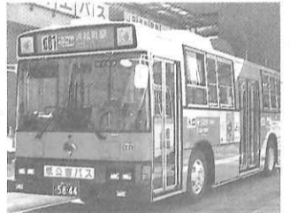
ハイブリッドバス

●省資源、廃棄物対策について 〔例〕ごみ処理システム、清掃工場、リサイクル場、臨海副都心(有明処理場、水の科学館、有明給水場)での上下水道に関する総合的学習