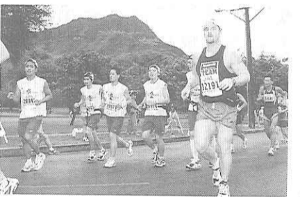
ホノルルマラソンに参加する生徒たち。