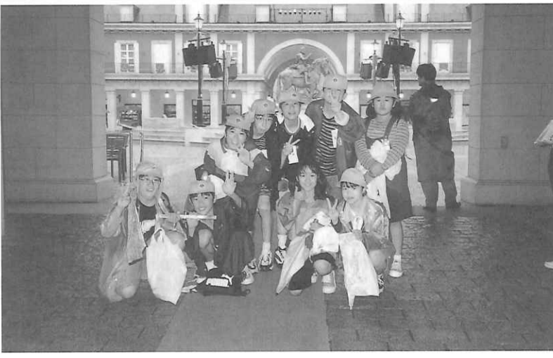
晴明丘南小学校 (二面に作文)

「主体的に活動し自ら学ぶ修学旅行」 第三十四回関東地区公立中学校修学旅行研究発表会 開催