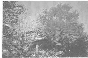
書斎とハゼの木も見納め

表参道や竹下通りだけでなく、自分のふるさとを見付けたい非非立ちたい所がある。 毎日10時～19時。第2月曜日・月末日及び年末年始は休館。 〒150東京都渋谷区神宮前1-18-10ラフォーレ原宿 電話：5413・2310 営団地下鉄千代田線明治神宮前5番出口又はJR山手線原宿駅下りから徒歩、明治通り西側、表参道と竹下通りの中間。正面のボンネットバスが目印。 サトウハチロー記念館 が11月末日に閉館 来年北京で再開予定 東京・文京区の「サトウハチロー記念館」が十一月三十日に閉館した。 詩人サトウハチロー氏の再開する予定である。