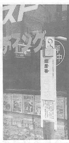
問屋場跡は旅行者に

今の季節の鎌倉は、小春日和のやわらかい日射しを浴びてそぞろ歩く観光客の中に、東京都内や近県から遠足に来ている子どもたちも、真剣なまなこで古都の文化を探り歩かざるを得ない。目立つ時期である。鎌倉の文化は、大きく分けて、頼朝から実朝の時代における京都や平泉の