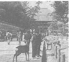
鹿と戯れる修学旅行生

でも五十近い費用を要しよう。今、仰ぎ見る大仏(国宝)も創建当時のままではない。近鉄奈良駅の登大路を東へ、そして国立博物館の先を左折すると、やがて国宝大仏殿が迎えてくれる。西側の阿吽一對の金剛力士像は、建仁三年(一一〇三)造立された木像最大の仁王像である。今回の修理で運