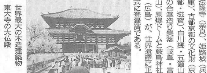
世界最大の木造建築物 東大寺の大仏殿

古都奈良の文化財を「世界遺産」に推薦 文化庁の文化財保護審議会は、「古都奈良の文化財」を世界遺産に推薦することを了承した。奈良県内では法隆寺に次いで二番目の登録となる。 対象は東大寺、興福寺、春日大社、春日山原始林、元興寺、薬師寺、唐招提寺、平城宮跡で、来年十二月に登録される見込み。 日本の世界遺産候補としては、日光の社寺(栃木)及び琉球王国の城・遺跡群(沖縄)も世界遺産委員会の「暫定リスト」に現在登録されている。