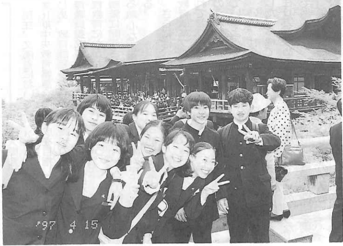
三日目は全員で清水寺へ (埼玉原日高市立高麗中学校 2面に作文)

財団法人全国修学旅行研究会(全修協)は、日本の教育の振興に寄与することを目的とし、教育を熱愛し子供たちの幸福を希求する人々の支持を得て、修学旅行の改善向上を目指して、全国的規模で活動する文部省許可の教育研究財団である。