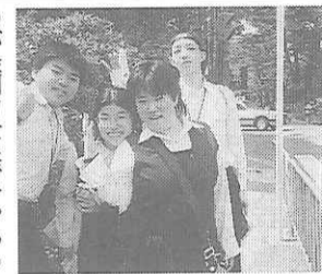
班別で京都を見学

奈良に共通して感動したところ、「おきき」です。その優しい言葉を、また聞きに行きたいです。 ◇高麗中学校旅行行程◇ 4/13 高麗→東京→京都 —近鉄奈良→大仏殿→班別研修→奈良→京都泊 4/14 京都市内班別研修 4/15 京都市内見学→京都→東京→高麗