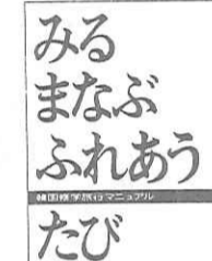
みるまなぶふれあうたび

東京角館は「まちの号」で最短三時間十一分。ただし、二往復(3.4.5.6号)は角館駅通過。