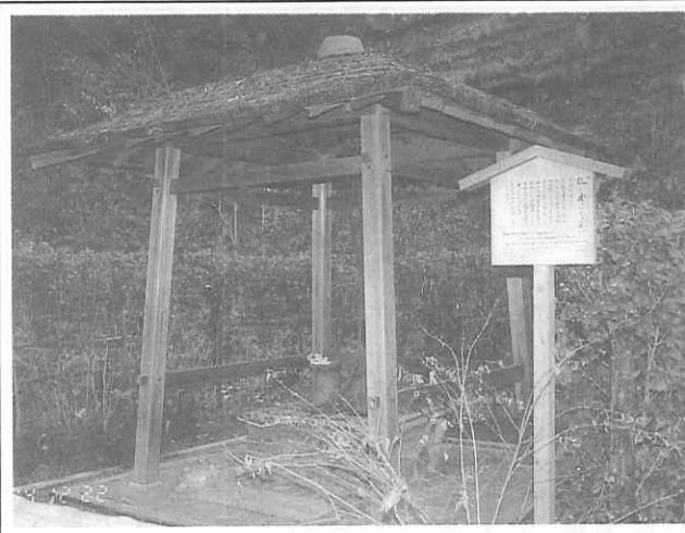
瓶の井・明月院境内

国際展示場「ビッグサイト」を中心に、お台場海浜公園、船の科学館、テレコムセンターなどがあり、東京の最新所として人気はますます上昇中。 アクセスは、新橋からの東京臨海新交通「ゆりかもめ」をはじめ、JR京葉線・営団地下鉄有楽町線新木場からの東京臨海高速鉄道や、日の出橋からの水上バス、そして定期バスは東京駅八重洲口・門前仲町・品川・大森などからのほか、二月からは浜松町駅発レインポータウンリッジ経由の新路線も運行を開始、ゆりかもめの混雑緩和が期待される。国際展示場への運賃は新橋から300円、新木場から200円、浜松町から200円。