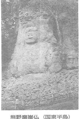
熊野磨崖仏 (国東半島)

財団法人全国修学旅行研究協会企画の平成九年度春季教職員研修旅行は、一月から各地で募集活動を開始した。 今春の全国募集コースは、「屋久島・種子島」など引き続き人気の高い継続コースに、NHK大河ドラマ「毛利元就」の生誕地をめぐり、その足跡をたどる「毛利元就」の地を訪ねるコースが、最終的には各地の単体企画を合わせた、約一千名の教職員、退職者とその家族が、春季休業期間中の研修旅行に出発する見込みとなっている。