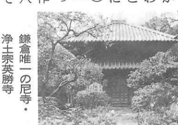
鎌倉唯一の尼寺・浄土宗英勝寺

口調は極めて激しく、仏教諸派を論難するところが多かった。初めは非難の声が集中したが、次第に信者や弟子が増え、宿谷光則など御家人のひそかな帰依を得るようになった。 このころ天災地変が続き、起り、庶民の難渋がひどかった。為政者としての対応についての進言を立正安国論としてまとめ、北条時頼に呈したが用いられなかった。 法然(長承元年一二三三)建暦二年一二二二)は美作(みまさか)岡山県