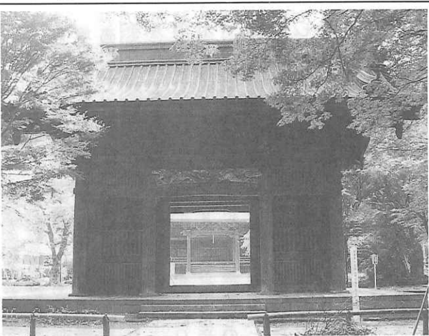
日蓮宗最古の寺・妙本寺

西倉津11.4km開通に続き、十一月十四日十五時には次の三区間が開通する。 ①磐城自動車道津川〜安田22.7km。西倉津〜津川は来年度開通し全通の予定。 ②上信越自動車道小諸〜更埴(こしよ)36.8km。長野自動車道に直結し、東京〜長野間は中央道松本線により時間の大幅短縮に。 ③山陽自動車道神戸〜三木小野27.7km。姫路へ来年度延長し全通の予定。 京都の夜の紅葉鑑賞 ライトアップの情報 今秋、各寺院の夜間公開予定は次のとおりである。 永観堂、圓光寺 11月1日〜12月1日。高台寺 11月1日〜12月8日。青蓮院 11月15日〜11月27日。東寺、清水寺・成就院 11月16日〜11月30日。