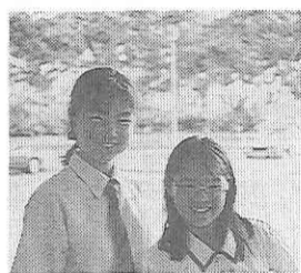
セラングーン高の友人(左)とファミリアの人にナイトサファリに連れていかれてもらいました。

よ、僕たちは君が再びこの家に来る事を望む」と言ってくれました。僕はホストの父に何と言葉を交わせばいいかわかりませんでした。僕は、シンガポールで言葉にはならない大切なものを手に入れたと思います。また自分の英語の普及の勉強不足を思い知らされる良い機会でした。ありがとう。シンガポール。