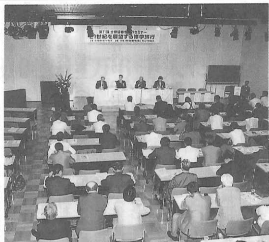
シンポジウム進行中の会場

財団法人全国修学旅行研究協会(全修協)は、日本の教育の振興に寄与することを目的とし、教育を熱愛し子供たちの幸福を希求する人々の支持を得て、修学旅行の改善向上を目指して、全国的規模で活動する文部省許可の教育研究財団である。