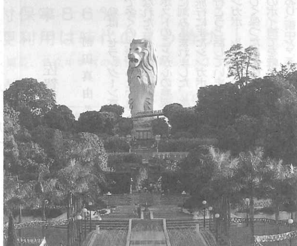
シンガポールも公立高の目的地に 新しいシンボルはセントーサ島のマライオンタワー (佐賀県立高志館高等学校 2面に作文)