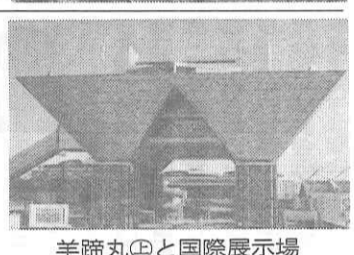
羊蹄丸⑨と国際展示場