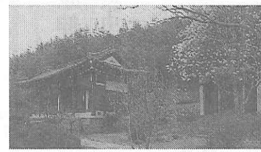
友鹿洞「沙也可」の里