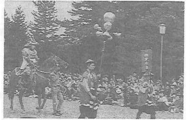
今年話題の羽柴秀吉一行

沿道の人気が集まる のは、徳川城使上洛列。か げ声とともに、毛槍が振り 上げられ、受け取られると 拍手がわく。 馬の参加も大変だ。御苑 内は土の道でよいが、ほか はアスファルト。さらに御 池通りは地下鉄工事中で鉄 板の道だ。馬術部学生が制 御するが、例年落馬がある という。 今年も秀吉ブーム。織田 公上洛列の中の羽柴秀吉 は、千成ひょうたんとも に花形だ。 平安時代の公卿列や鳳輦 も見事だが、共に歩む童子 ・童女のかげんな姿にカメ ラのシャッターが集まる。 そして京都の秋は深まって いく。