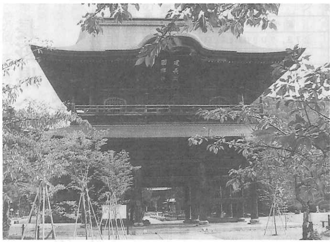
五山の一位・臨濟宗建長寺山門

修学旅行の専門紙 修学旅行新聞 購読のお願い 定価1か年2,000円 税・送料共(月刊) お申込は(財)全修協へ ☎03・5259・0631 FAX03・5259・0630