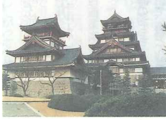
美しい現代の伏見桃山城

鉄筋コンクリート造りの天守閣と、キャッスルランと名付けられた遊園地のさわめが現代だ。天守閣に登ると京都一円が見渡せる。ほかに秀吉の夢に思いを馳せる。