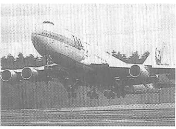
大空へ離陸するジェット機 飛行機の方に機内であつた...