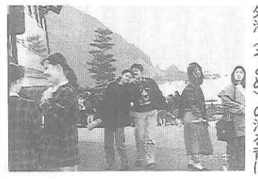
ド・ロ神父が着工、翌年に完成したもので、数少ない...