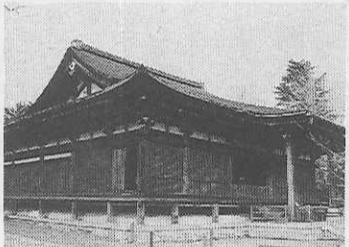
旧市内最古の大報恩寺本堂