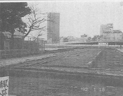
出土した駅舎とプラットホームの跡、①は駅弁の茶器

発見されたが、庄巻は史跡0マイル標識「横から一直線に延びるプラットホームの跡である。地表から二メートル、幅九メートル、長さ四百四十四メートル、段ボール箱のような切り石が四段に積まれている。更に、東海道の駅で売られた茶器も出土、「大垣」「濱松」「沼津」「桃中軒」などの文字もはっきり読み取れる。 「早や我が汽車は離れたりの前方には新幹線が走り、世界貿易センターの高層ビルがそびえて、愛宕の山は見えなくなったが、再開発による新交通システムの建設が遅れても、汽車の旅・修学旅行のルーツは何となく残してほいものである。」