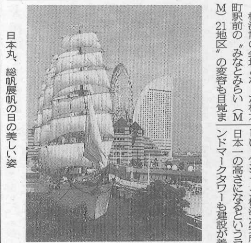
日本丸、総帆展帆の日の美しい姿

横浜は二月一日の大雪、二日の大地震で私立校の受験生に影響が出たが、三日は節分、四日の立春・旧正月には中華街で春節祭が盛大に行われ、春が近づいて来た。三溪園や称名寺、大倉山など、梅の名所もにぎわいをみせている。 横浜博の会場となった桜木町駅前の「みなとみらい」M21地区の変容も目覚ましい。パシフィコ横浜が完成、日本一の高さになるといわれるランドマークタワーも建設が着々進行している。