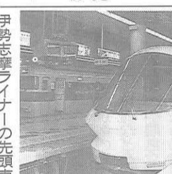
伊勢志摩ライナーの先頭車

来る四月二十二日にオーブンの「志摩スペイン村」をはじめとする伊勢志摩方面への輸送力増強のため、近鉄が新造した車両で、六両編成、時速百三十キロで走る。車両はアーバンライナー型の流線形、明るい黄色と白のツートンカラーで、試乗車にも各所に鉄道マニアのカメラが待ち構えるほどの好評だ。