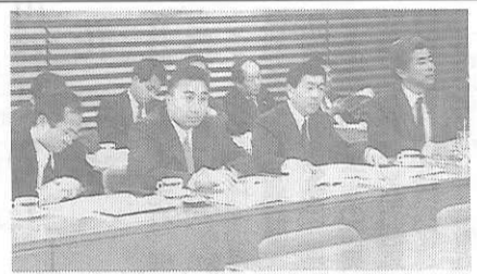
京都の旅館代表と意見交換

平成七年度の中学校連合修学旅行については、昨年度より大都市圏では、公立中学校の生徒数減少が特に著しく、近畿の両地区でも相次いで輸送計画を決定、発表の運びとなった。各地方とも生徒数の減少が続いており、三地区合計では平成六年度より約三万人の減少となった。 私立中学校への進学者が多い大都市圏では、公立中学校の生徒数減少が特に著しく、東京都の公立中学校連合は八万一千人となっており、平成六年度より二万三千人も減少しており、近畿各地方とも生徒数の減少が続いており、三地区合計では平成六年度より約三万人の減少となった。