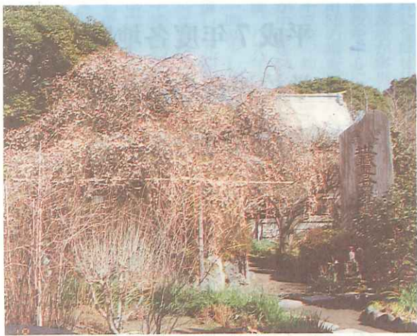
美しい枝垂梅の咲く萩の寺・宝戒寺

鎌倉の寺の多くは、入り組んだ山びた(谷戸)や(一層心)の形に造られている。早稲の柔らかな谷戸の陽だまりには、梅や水仙が楚楚とした花をつけて、かすかに芳香を漂わせている。時に、かすかな風が流れる。名を知られる。