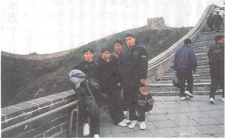
万里の長城に登り 中国の偉大さを知る (中村学園三陽高 左から2人目が?面作文の筆者)