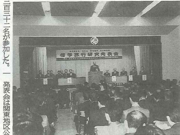
29回目を迎えた修学旅行研究発表会