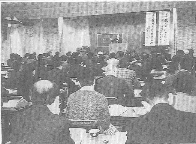
盛会の修学旅行研究協議会（1月7日 盛岡）

五日制実施による修学旅行への影響面などの課題を指摘、「新時代にふさわしい修学旅行の創造」を目指す全修協の基本的姿勢を明示して、参加者の共感を誘った。 午後は中学校部会、高校部会に分かれ、東京と京都の修学旅行旅館代表者、旅行会社代表者も参加して、「魅力ある修学旅行をつくる」その現状をみつめて討議が行われ、夕刻四時前閉会した。