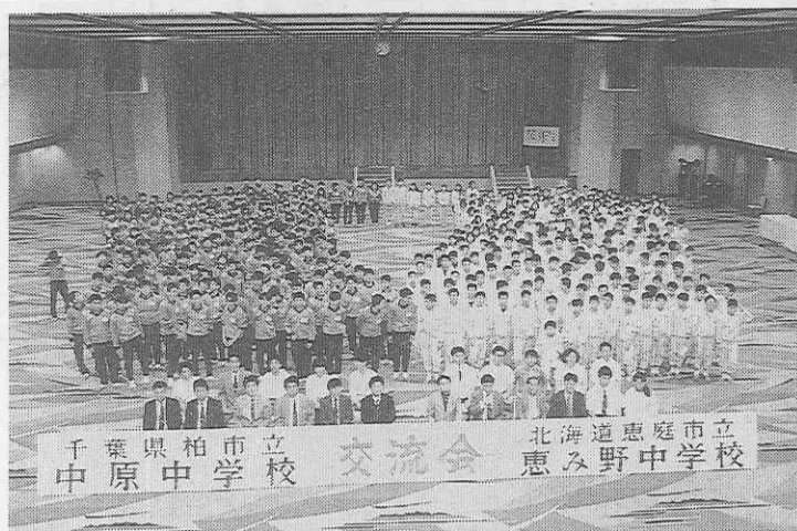
大ホールに全員集合し交流会を開催

修学旅行の宿舎でのトラブルを避けるため、「一校一館主義」が主流となっているが、シーズン集中と児童生徒数減少で最近は一校以上が一館に同宿するケースが増加している。五月二十一日、岩手県花巻温泉のホテル千秋閣に同宿した北海道と千葉の二つの中学校が「これも何かの縁」と交流会を盛大に開き、成果を上げたので紹介したい。