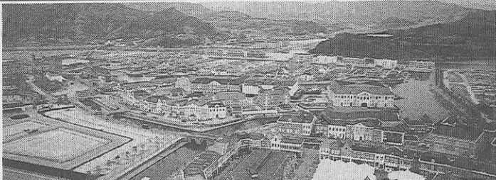
美しい街並みと美しい光景

三月十三・十四の両日、長崎オランダ村ハウステンボスの事前視察会が開催され、ほぼ完成した施設内を二日間にわたって見学した。 大村湾に面し、総面積百五十二ヘクタール、施設内面積百二十ヘクタールと広大なもので、水と緑とオランダの街並みを再現、今まで余り例を見ない新しい施設である。 施設の名称「ハウステンボス」は、オランダ・ハーグ市にあるペートルクス女王の宮殿「パレス・ハウステンボス」から名付けられたということ、宮殿の外観を再現した建築物がメインの施設として設置されている。 施設全体がオランダの街並みを再現し、幾つものゾーンに運河で区切られ、運河には観光船、道路には街とマッチ