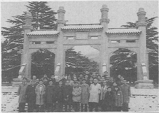
歓迎全修協中国研修旅行団