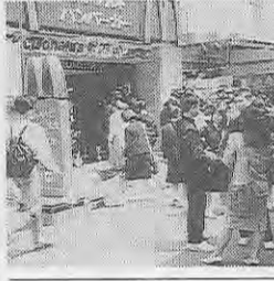
安全快適な新幹線は修学旅行に不可欠