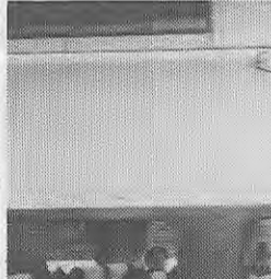
安全快適な新幹線は修学旅行に不可欠