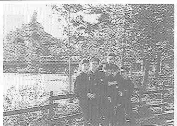
ディズニーランドも大好き