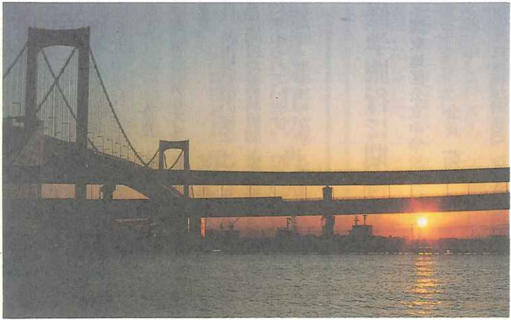
(東京・芝浦 レインボーブリッジ)

平成六年の新春を迎え、皆様の御健勝と御活躍を心からお喜び申し上げます。昨年は、前年からのバブル経済の崩壊が尾を引いて国民生活の低迷を招き、冷夏による米の凶作がこれに拍車をかけ、また、ゼネコン汚職の発生が政治不信を醸成して政界は動揺を来すなど、社会全般に不安定要因の多い一年でありました。 教育界においては、新学習指導要領が、平成四年度の小学校に続いて、中学校全学年で全面実施され、これをもって義務教育の段階における教育課程改善の方