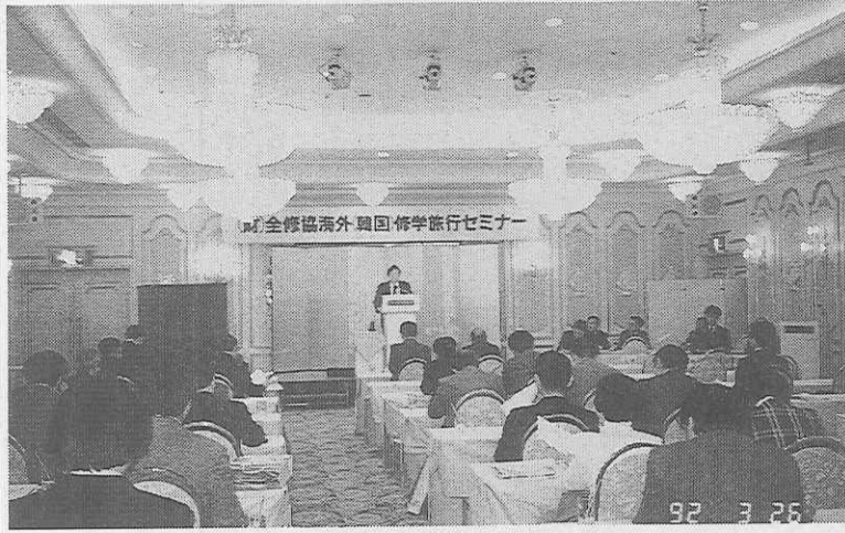
セミナー会場での説明を熱心に聞く