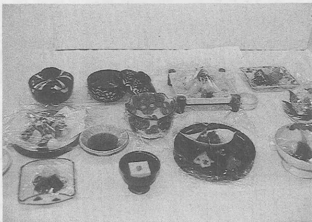
これが修学旅行の夕食!! 豪華な京会席料理

修学旅行シーズンを迎え、恒例となった献立講習会が、三月十三日午後、京都市役所前の本能寺文化会館で開催された。