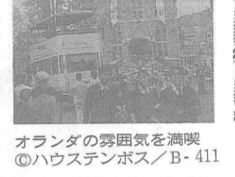
オランダの雰囲気を感じて ①ハウステンボス/B-411

復元リブテ号上のショー。シボルト出島閣館での文化交流に多大な貢献をされていることでしょうか。場内でも果たした出島の役割。当時珍重された伊万里磁器を室内装飾に用いたボルセレイを再利用、最後には土中浸透により海へは直接一滴も排水しない、熱源は天然ガスです。