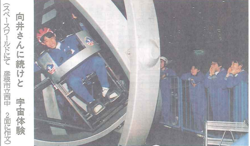
向井さんに続けと 宇宙体験 スペースワールドにて 彦根市立西中 2面に作文

東京の初夏を彩る夏祭り、神田祭と浅草の三社(さんじや)祭が五月十四・十五の両日、盛大に行われた。例年、神田祭が先であるが、今年には学校が休みになる第一土曜日に合わせ、同時開催となった。十一年ぶりのことである。神田祭は神田から日本橋にかけての各町内から百基近い神輿(みこし)が神田明神へ続々宮入りし、神田市場の千貫神輿も七年ぶりに登場した。人出は三軒祭の方が上。浅草とあつて修学旅行生も多数自主見学していた。神輿には昔懐かしい町内会の名が書かれている。浅草や日本橋は住居表示整備が完了し、神田でも鎌倉町や金沢町などは内神田、外神田に統合、旧町名は消滅したが、全修協のある錦町を始め、北薬物町、東紺屋町、松永町、練馬町等々は今も健在だ。▼ここで新発見、神田で「まち」と発音するのは小川町だけで、それ以外はすべて「ちやう」である。大江戸八百八町でも同様に「ちやう」が多い。仙台は町と区別されていた。全国の市町村名を、東日本では「まち・むら」と呼ぶが、西へ行くと「ちやう・そん」が多くなる。▼閑話休題。京都では五月十五日の葵(あおい)祭が雨で一日延期され、修学旅行の予定が狂った。七月は祇園祭、続いて建都千二百年記念全国祇園祭山笠巡幸がある。▼伊勢では世界祝祭博覧会が七月二十一日から十一月六日まで開催される。百八日間の会期中、大いに盛り上っている。