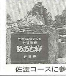
佐渡コースに参加して

今、職員室の掲示板に教職員研修旅行のポスターが掲示してあります。あまり関心がないのか誰も目を向けてくれない。でも私、このポスターが掲示されるのを心待ちにしています。そんなコースがあるのか、出発日はいつなのか、いつも関心をもちて見ます。