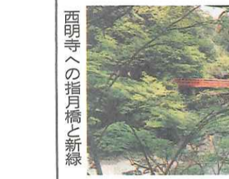
西明寺への指月橋と新緑

平安時代の火災後、復興に努めたのは文鏡であった。平安初期密教美術の代表的錦雲帳と呼ばれる深谷を望む。