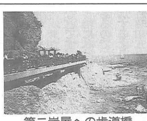
第二岩屋への歩道橋

神奈川県藤沢市の江の島南側にある岩屋洞窟は、昭和四十六年春の落石事故以来閉鎖されていたが、同市が修復工事を行い、去る四月十八日、二十二年ぶりに再び公開された。