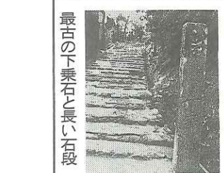
最古の下乗石と長い石段

三尾の最も奥が梅尾高山寺だ。嵯峨天皇の詩にちなんで名付けられた白雲橋を渡った所から表参道が通じる。開山明恵上人が「日出先照高山之寺」の勸額を後鳥羽上皇から拝戴したことから寺名となった。