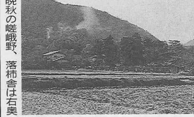
晩秋の嵯峨野、落柿舎は右奥

……小きく 去来の墓の時雨けり (柳史) 高松三十三センチあまりの目が然石に、「去来」とのみ刻まれたのが去来の墓だ。二尊院への途次にある入口には、瓢箪の句が案内板を兼ねる。……秋風に吹き残されて墳