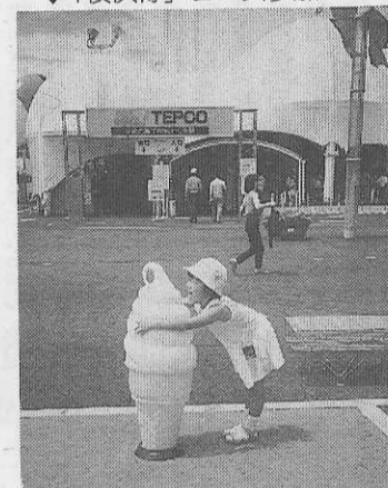
入選 ぼくも仲間入り