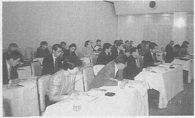
熱心に話を聞く参加者(福岡)

(一画からつづく) ①面からつづく) 学びたいという教員が多い。③外国語に日本語を導入している学校がある。中学、高校に各一学校区。 ④七学校区とも日本の学校との交流を熱望している。交流の中心は文通、教員や生徒の交換、姉妹校提携等である。なお、留学生の受け入れについても、今後拡大したい意向である。 ビデオでホームステイプログラムを放映 (主な内容) ①ホストファミリーに対するオリエンテーション ②ウェルカムパーティの様子 ③ホストファミリーでの生活とマナーについて ④ホームステイプログラムの紹介、学校での英会話研修、市内や郊外の見学風景、施設訪問の状況など ⑤さよならパーティの様子 ⑥教育事項についての質疑 ⑦使節団から参加者に(質問事項のみ掲載) ⑧日本の学校では、掃除を生徒にさせていると聞くがどうか。また、その目的は……。 ⑨日本では精神障害者や能力の低い子供たちの指導を、どのようにしているか。 ⑩学校で福祉的なことをしているか。 ⑪全米の統計では、高校生の25パーセントがドロップアウトしている。よいアドバイスは……。 ⑫参加者から使節団へ(問)学校がかかえている問題点は何か。