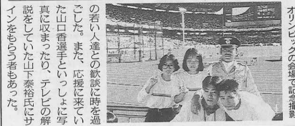
オリピックの会場で記念撮影

今回のメインとなった安久島(ヨイド)高校との文化交流会では、韓国側は「夕焼け小焼け」、日本側は「アリンコ」を歌ったあと、紫野高校新体操部員三人が練習の成果を披露。さらに一人ずつ贈物を交換した。日本からは京人形や絵葉書、韓国からはオリピック・マスケットの縫いぐるみや青磁小皿などが贈られた。