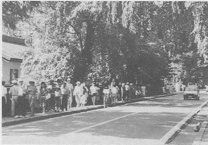
みちのくの小京都—角館