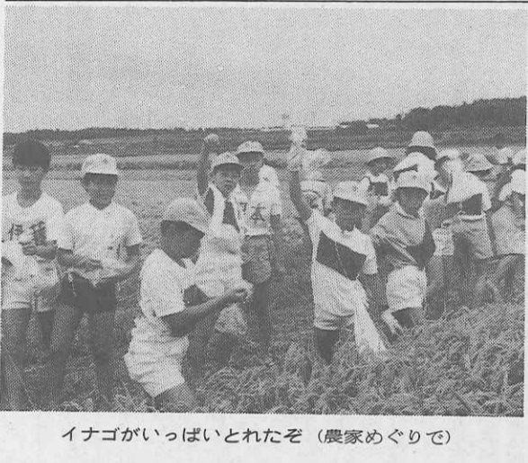
イナゴがいっぱいとれたぞ(農家めぐりで)

東京都江戸川区では、かつて十三泊十四日の長期にわたるセカンドスクールを実施していた例もあるが、二年前から毎年区内の小学校二校を選び、六泊七日の長期移動教室を茨城県水海道市の「あすなろの里」で行っている。本年度の実施校の一つ、西小岩小学校(氏家園)校長を訪問、成功裡に終了したその実施結果を聞いてみた。