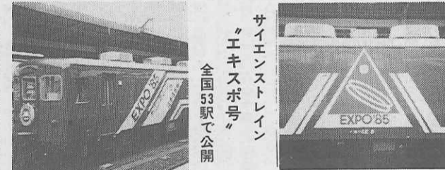
サイエンストレイン エキスポ号