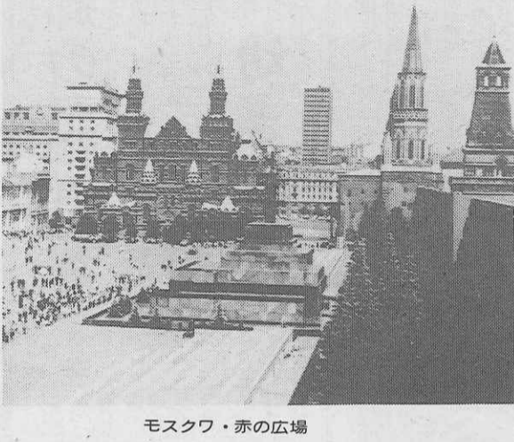
モスクワ・赤の広場