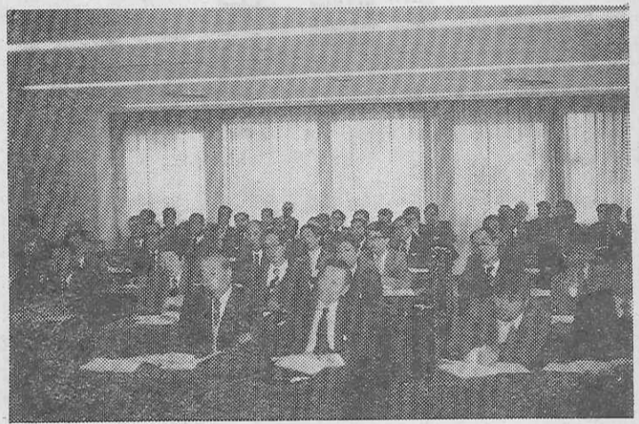
研究発表に聞き入る参加者(水戸市で)

「とにかく生徒たちは解放感、先きに立ち、観察学習がもたらす効果に勝つた。これを効果的にするために観察事項と方法の設定が必要であり、例えば東海地方ではメカトロニクスの一部であるその景観を観察し、位置、自然、人びとの活動の一部を理解する。内容としては地形概要、土地利用、工場分布、都市化のようすが挙げられる。また、京都・奈良方面では、古い都の所在地におしにも観察記録用のページを設けた。