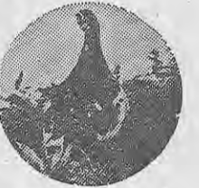
保護色のライチョウ