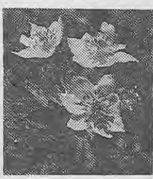
ハイマツ帯の住人

ノキバナシヤクナゲ・クロマノキなどの低木はえています。そしてここがライチョウの大切な住み家なのです。とくにライチョウは生きた化石といわれ、国の特別天然記念物に指定されていますが、彼らの生活を守り、心ない登山者とならないよう、じゅうぶんに保護せねばなりません。