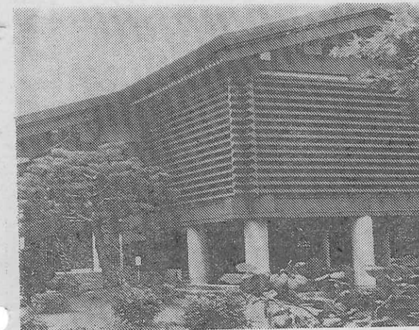
巨匠の画業にふさわしい校倉づくりの棟方志功記念館

花を愛し、生けものをいっしょにした棟方志功は、その作品のなかに多くの「自然」を生み出している。たとえば「ミズナク、フクロウ」である。これらを生かした作品をいくつか見たい。フクロウは昔から英知のお使いとしてこの世に生きつづけてきたが、棟方志功はそれを知っていたが、かたがたに、だが、愛嬌のある大きな眼、こもりのくちくち、かわいらしい羽毛、小首をかしげるかわいらしい動作などに魅せられていたのは間違いない。