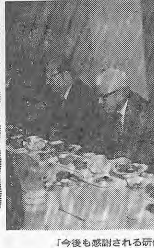
「今後も感謝される研修旅行に」と話がはずむ座談会