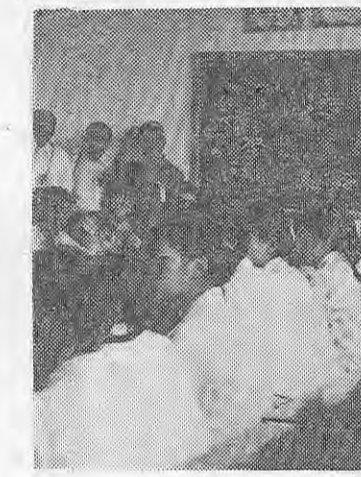
西安第83中学の授業をみる

黄土高原の上空にさしかかると、黄土高原の大木が広がる。この大断面の西方に緑化帯はまた一帯が移山・改造に学ぼうとすむかけた。その焦点は山西の晉陽県にあり、いま筆者たちはるか遠方ではあるが、晋陽県にみえたい。大案は、また工業は大慶(油田)に学ぼうの大慶とともに、中国動労人民の典型(自力更生)、生産の手本とされている。 黄土高原での緑化は七二〇万畝以上に及んでいるとのことである。太原飛行場に接近するに従って、樹皮状に形成された大侵蝕谷をみる。厚く堆積された黄土では、夏季に集中する降雨の流水侵食作用が強烈なため、地盤盆地の太原盆地の広い地域にわたってこのような地形がみられる。 太原飛行場で少憩のち離陸し機は汾水の上空に入る。