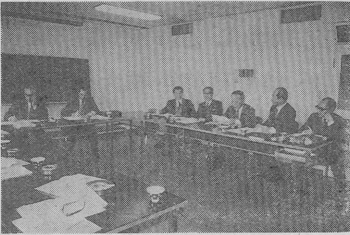
協議をかさねる第1回編集委員会 (国立教育会館で)

第一回の編集委員会は三月八日午前十一時から東京・千代田区の国立教育会館に左の編集委員全員が参加して開催した。