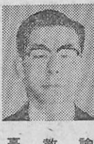
教諭 靖 靖

●魅力ある自由見学 この日は、市内・東北におよび保護・東北コースを教諭が、「飛馬」コースを私が担当した。 十月九日(水) HRタイムに奈良選抜コースの打ち合せ。コースとバスとで指定された教室に集合し、現地で同行する担任から注意があり、係の生徒の決定を、